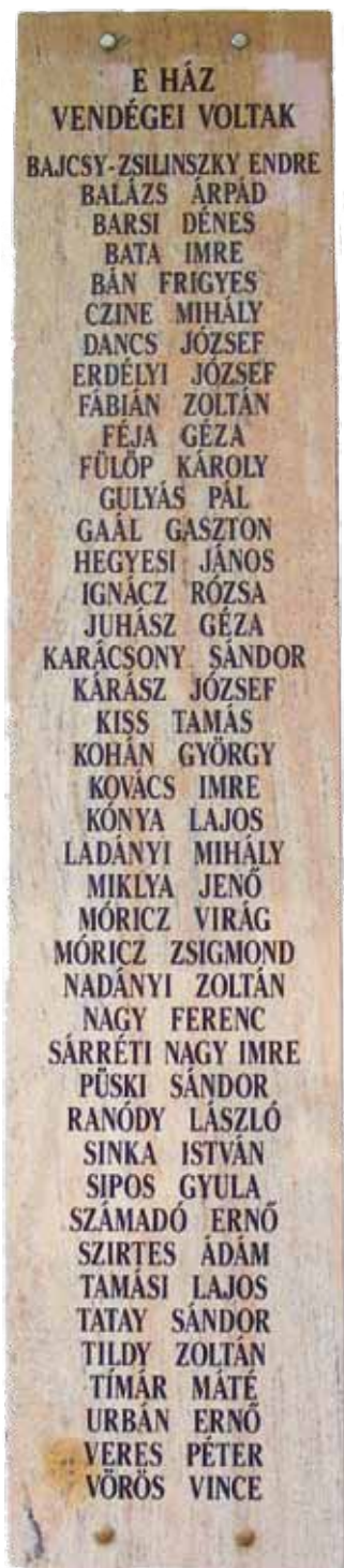
Emléktábla ház falán

1971-ben a család emlékszobát alakított ki az író kedvenc helyén: a verandán. Összegyűjtötték kedves használati tárgyait, bútorait.