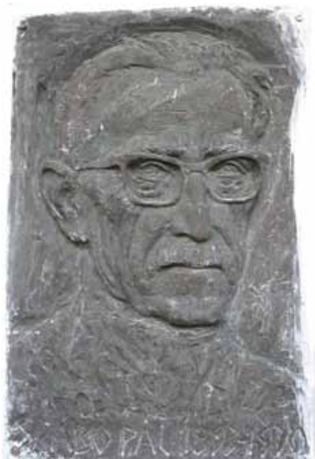
Az író portréja a ház falán

dákat. A bontáskor derült ki, hogy az öreg ház mennyezete napraforgószárból készült. A tornác faágasai helyére fehérre meszelt kőoszlopok kerültek. A pénz azonban hamar elfogyott, ezért az alsó szobát már csak tapasztották, mivel nem futotta vakolásra.