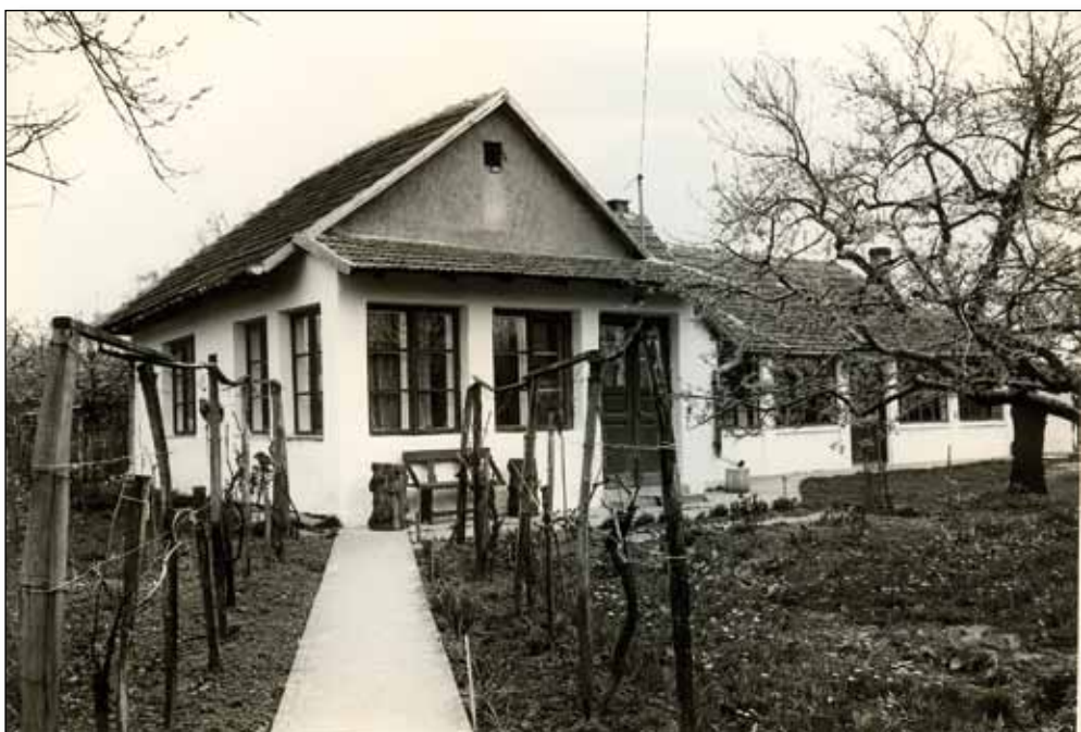
Az író háza a 1970-es években