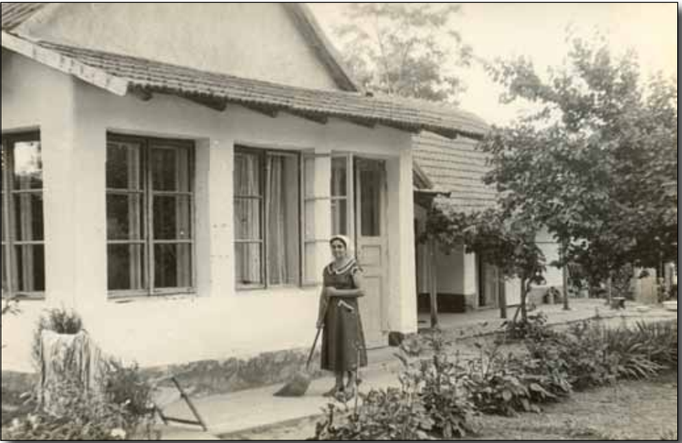
Az író felesége az újonnan kialakított dolgozószoba