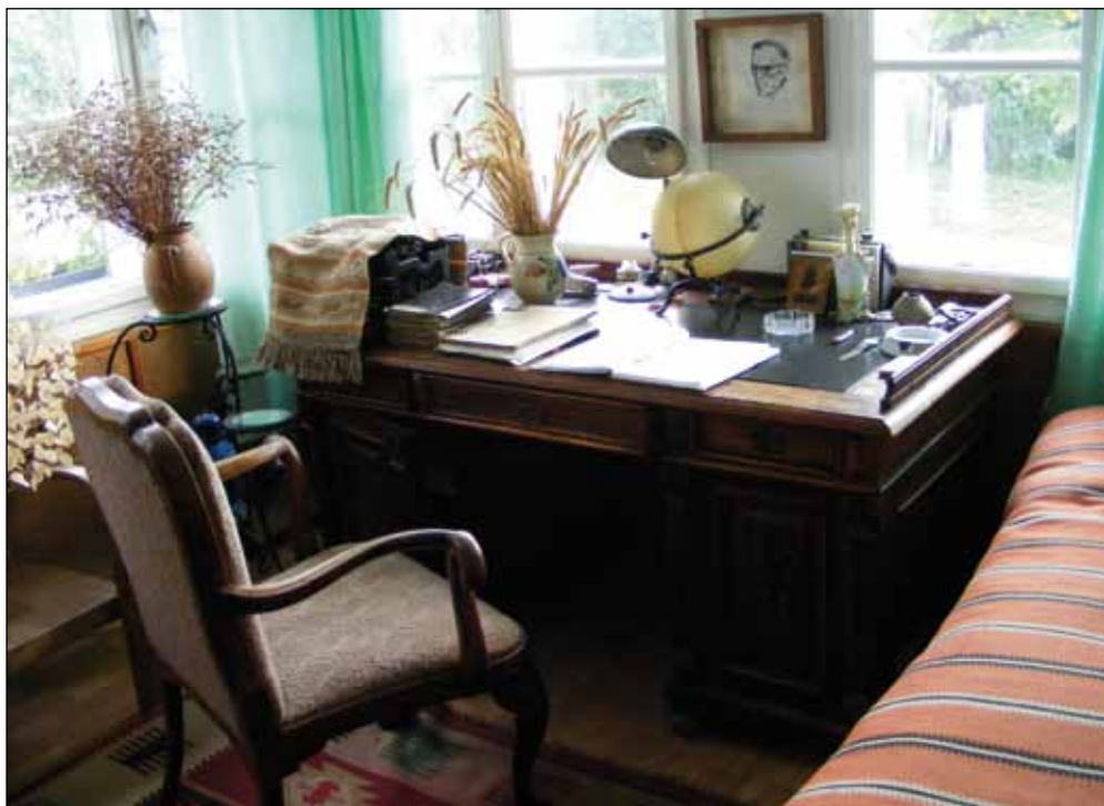
Jeles művek születésének színhelye