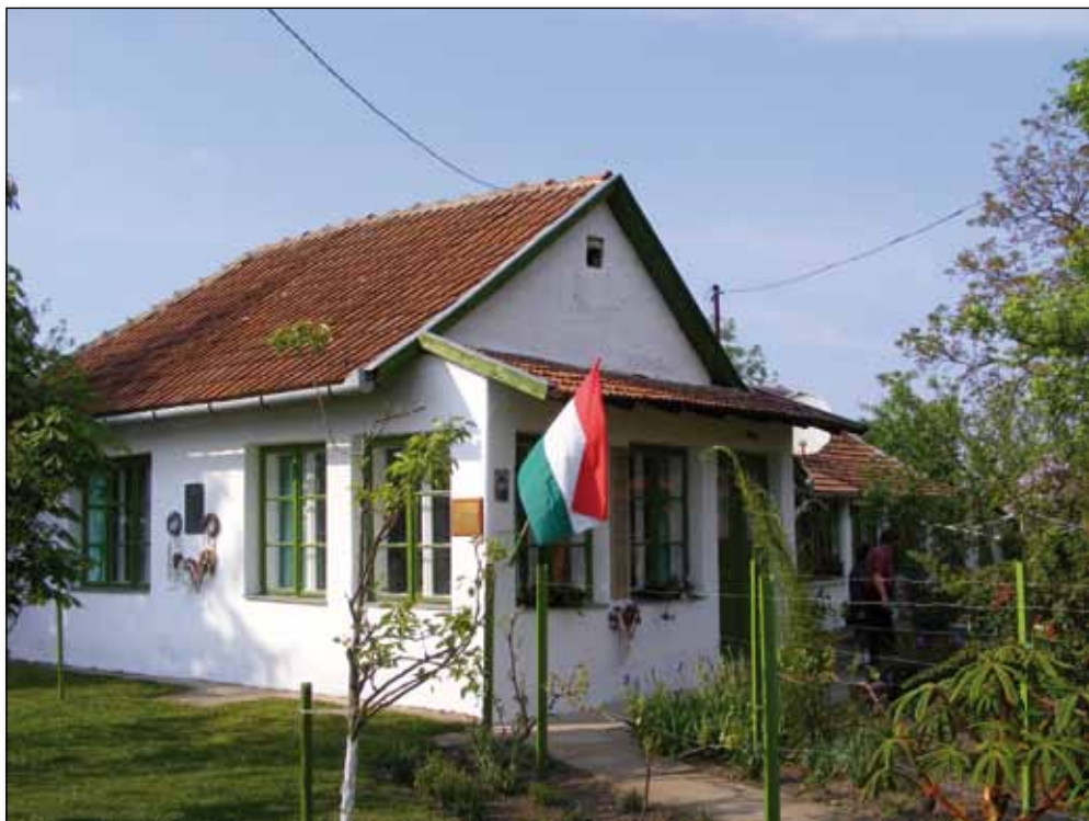
Az író háza napjainkban

Szabó Pál 1970. október 31-én bekövetkezett halála után még egy átépítés történt a házon: a tornácot beüvegeztették, s az istálló helyén konyhát és fürdőszobát alakítottak ki.